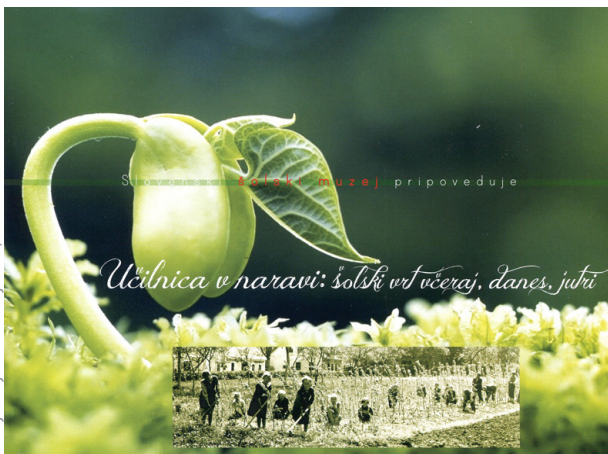
Otroci na šolskem vrtu, Državna ljudska šola v Sentijerneju na Dolenjskem, okoli 1930

Ob primerih dobrih izkušenj bomo predstavili, kako bi bili lahko še bolj učinkoviti pri uresničevanju ciljev nacionalnega programa o prehrani in telesni dejavnosti za zdravje Dober tek, Slovenija , če bomo kreativno (kreativna partnerstva) povezali različna področja, ter kako lahko skupaj, s celovitim pristopom in sodelovanjem, prispevamo h kakovosti življenja naših otrok in vsakogar od nas.